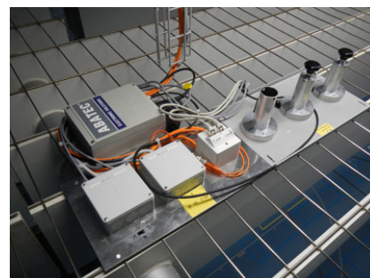
Installation eines Endpunktes