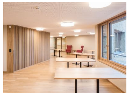
Bilder: Brügger Architekten AG und Roland Trachsel Fotografie

Da das Pflegeheim während der Sanierungsarbeiten teilweise bewohnt blieb, musste besonders Rücksicht genommen und die Arbeiten genau terminiert und koordiniert werden. An die Fachbauleitung wurden dadurch hohe Anforderungen gestellt.